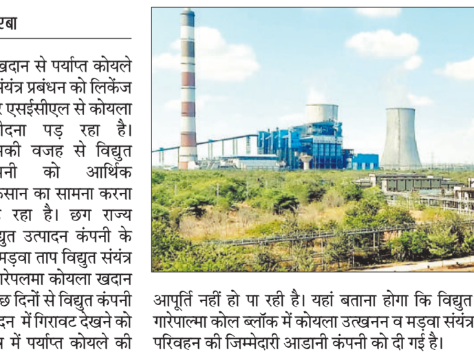
आपूर्ति नहीं हो पा रही है। यहां बताया होगा कि विद्युत कंपनी के गारेपलमा कोल ब्लॉक में कोयला उत्खनन व मड़वा संयंत्र तक कोल परिवहन की जिम्मेदारी आडानी कंपनी को दी गई है।

विद्युत कंपनी के गारेपलमा स्थित कोयला खदान से पर्याप्त कोयले की आपूर्ति नहीं हो पाने की वजह से मड़वा संयंत्र प्रबंधन को लिफ्टेज के निर्धारित दर से 40 प्रतिशत अधिक दर पर एसईसीएल से कोयला खरीदना पड़ रहा है। जिसकी वजह से विद्युत कंपनी को आर्थिक नुकसान का सामना करना पड़ रहा है। छग राय विद्युत उत्पादन कंपनी के 1000 मेगावाट विद्युत उत्पादन क्षमता वाले मड़वा ताप विद्युत संयंत्र में विद्युत कंपनी के रायगढ़ जिले में स्थित गारेपलमा कोयला खदान से कोयले की आपूर्ति की जाती है। पिछले कुछ दिनों से विद्युत कंपनी के गारेपलमा कोल ब्लॉक से कोयले के उत्पादन में गिरावट देखने को मिल रही है जिसकी वजह से मड़वा संयंत्र में पर्याप्त कोयले की