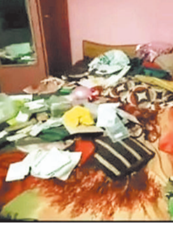
चोरी के बाद घर में बिखरा सामान।