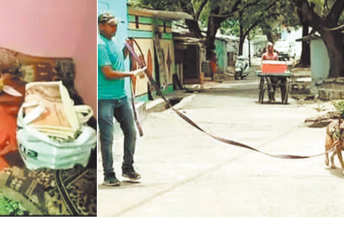
खोजी डग की मदद लेते पुलिस कर्मी।