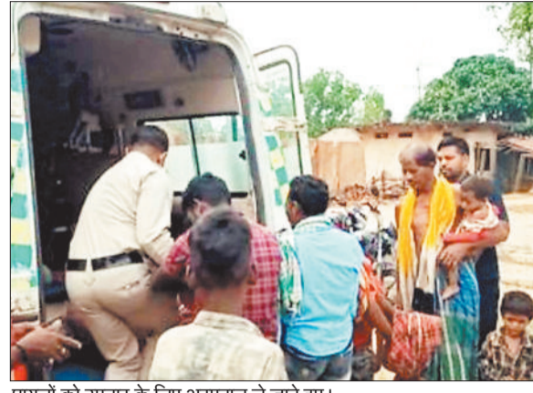
घायलों को उपचार के लिए अस्पताल ले जाते हुए।