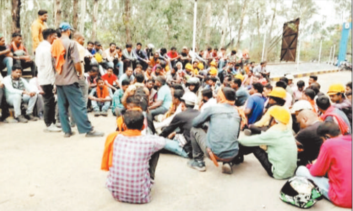
जीएम कार्यालय के बाहर धरना प्रदर्शन करते रूंगटा कंपनी के ठेका श्रमिक।

हरिभूमि न्यूज ►► कोरबा एसईसीएल गेवरा में कार्यरत आउटसोर्सिंग कंपनी रूंगटा के कर्मियों ने काम बंद कर जीएम कार्यालय का घेराव कर दिया। ठेका श्रमिकों का आरोप है कि रूंगटा कंपनी अपने वर्कर्स को केंद्र सरकार द्वारा निर्धारित दर पर वेतन भुगतान नहीं किया जा रहा है। कंपनी द्वारा आधा वेतन खाते में और शेष राशि नगद दी जा रही है। 25 हजार प्रतिमाह के वादे के विपरीत वेतन भी कम दिया जा रहा है।