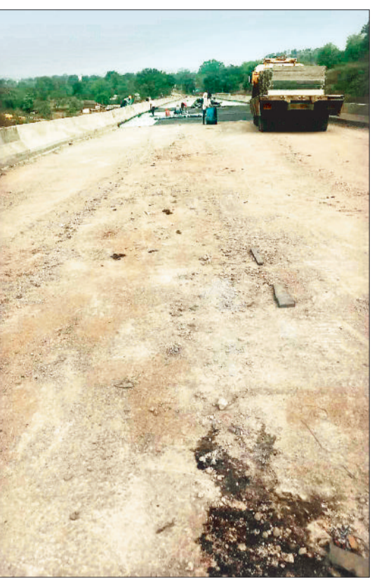
बायोडक्ट के पास की अधूरी सड़क।

एनएच 43 स्थित लुचकी घाट के खतरनाक मोड़ों से मुक्ति दिलाने के उद्देश्य से बनाए जा रहे बायोडक्ट का निर्माण एक साल से चल रहा पुल निर्माण